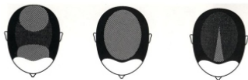
Patrón Masculino (Hamilton)